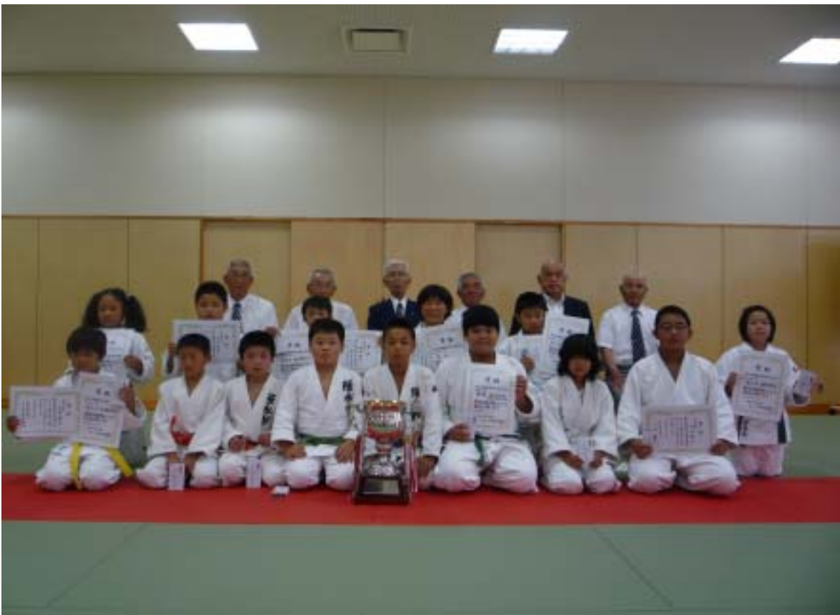
団体戦優勝チーム 各学年個人戦優勝者